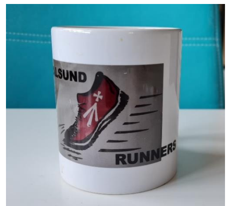
Immer in Bewegung zum Mund, die Kaffeetasse der Runners.