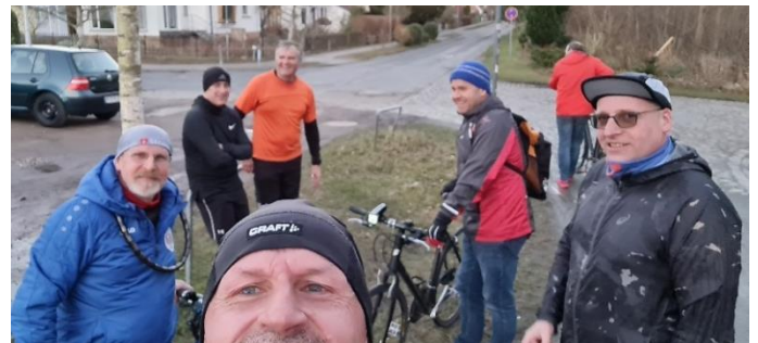
Februar 2022: Hier wurde schon die Stadtwald Runde belaufen. Die Akteure sind immer heilfroh nach Beendigung der Laufrunde ☺