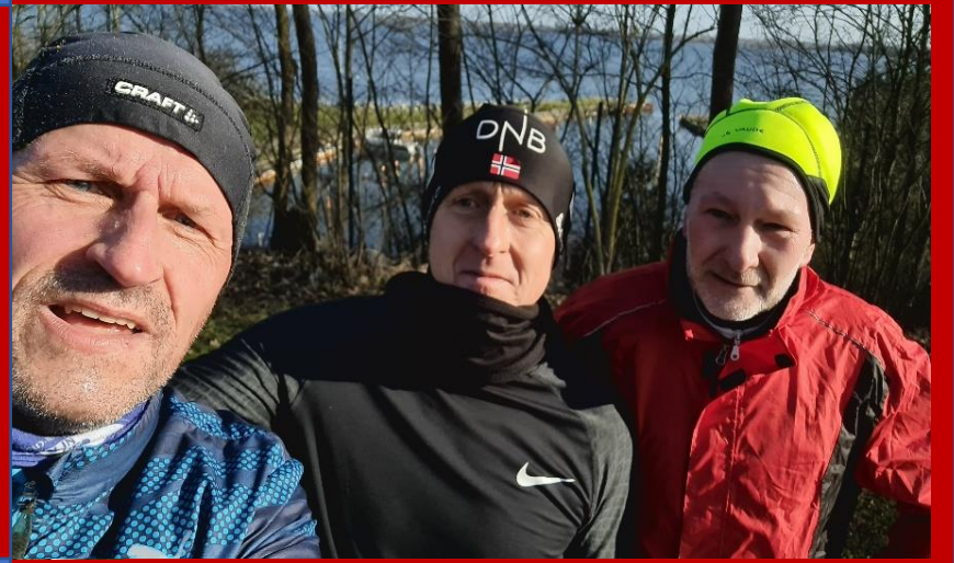
Ein Läuferchen an der Sundpromenade.

Im Februar 2022 passierten aber auch andere schöne und unschöne Dinge in der Welt. Zu den schönen Sachen gehörte wohl doch Olympia in China. Trotz aller Coronamaßnahmen und Abschirmung für alle Sportler, holte Deutschland gute 12 Goldmedaillen. Damit war Platz 2 in der Wertung der Nationen gesichert. Auch HANSA Rostock holt wichtige Punkte für den Klassenverbleib in Liga 2.