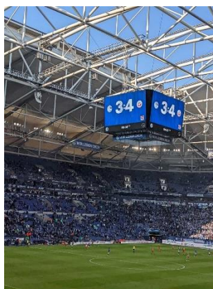
Sensationell. Hansa gewinnt auf Schalke 4:3.

Olympia 2022, Medaillenregen für Deutschland.