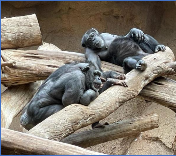
...einfach mal abhängen auf den Kanaren.